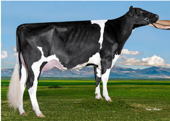
WESTCOAST FORTUNE GOLDIE 5870

LADYS-MANOR OCTOBERFEST MS HUE TANGO 57644 VG-86-2YR-USA 3* MR WELCOME HILL TANGO LOOKOUT PESCE EPIC HUE VG-86-3YR-USA 3* GENERATIONS EPIC COOKIECUTTER MOM HUE VG-88-2YR-CAN 21*